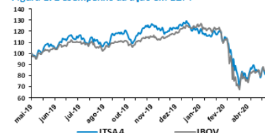
Figura 1: Desempenho da ação em 12M

Fonte: Economatica. Projeções: Planner Corretora.